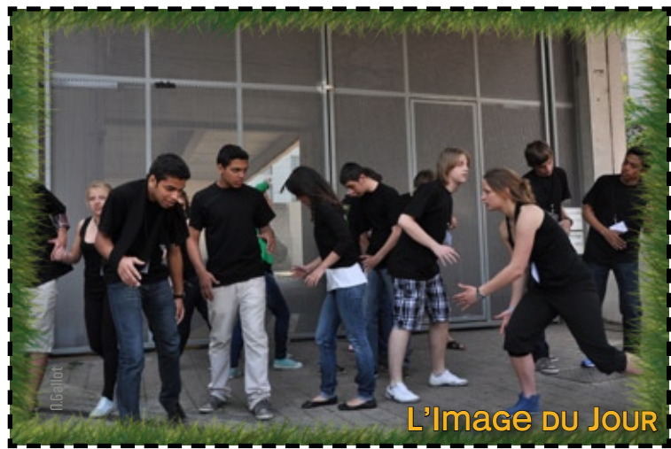
L'Image du JOUR